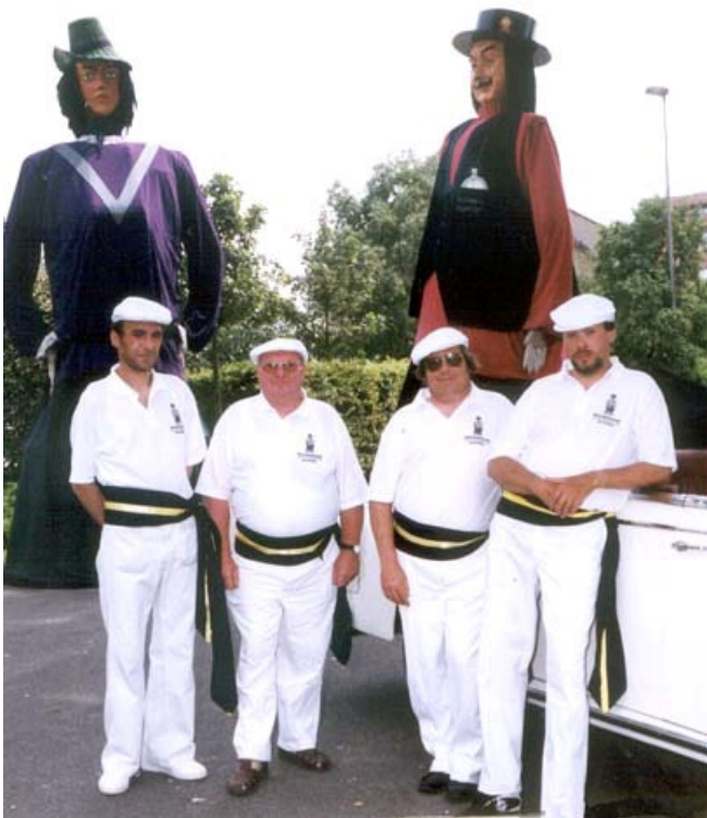
Op de parking van Salons "JAN TURPIN" tijdens een Miss Verkiezing.