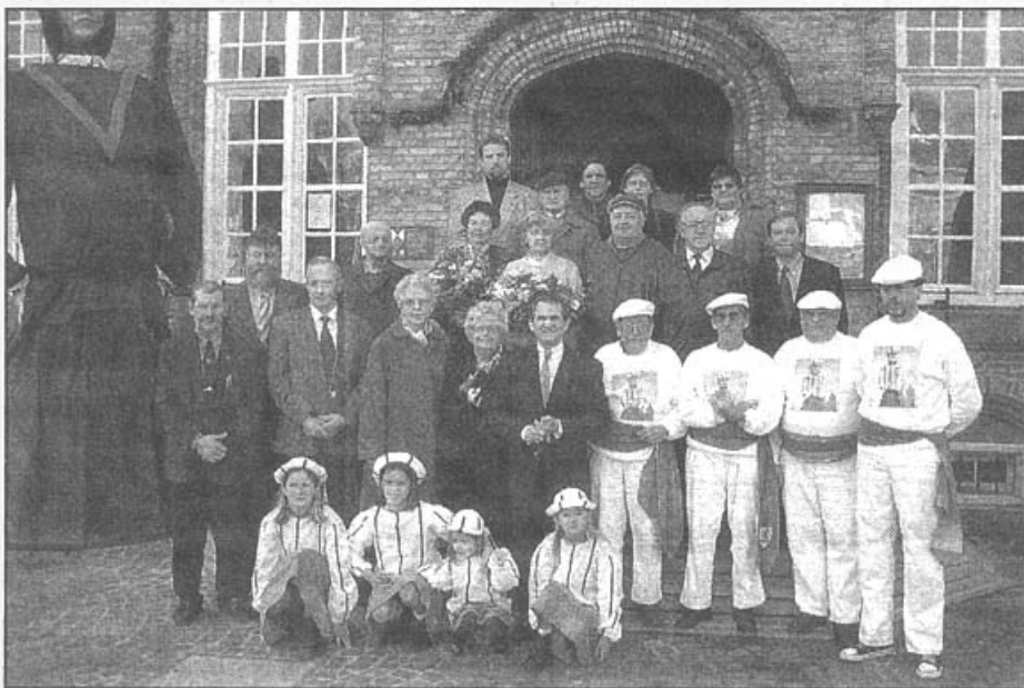
De gevierde reuzendragers en het gemeentebestuur op de pui van het stadhuis.