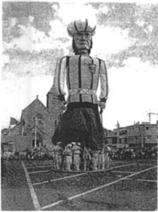
Zaterdag 25 september 1999