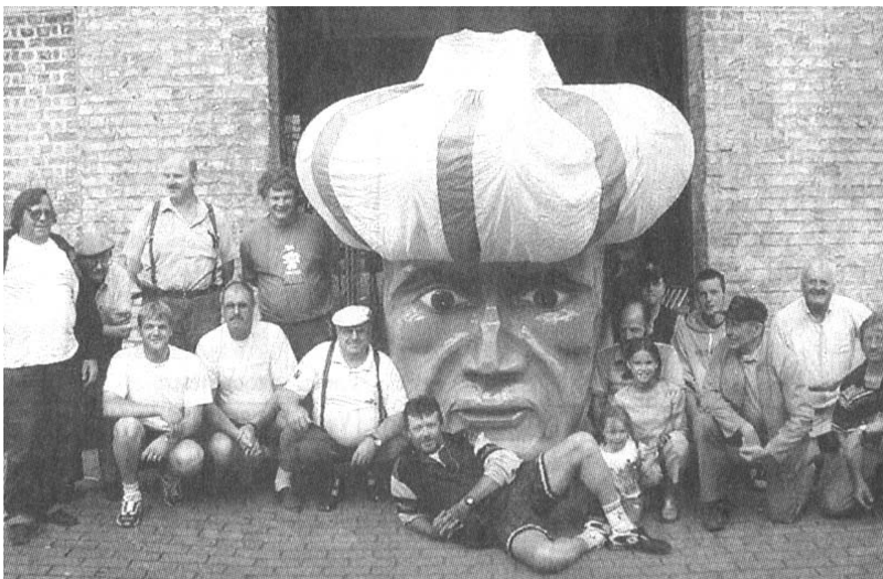
Foto genomen in de Hoogstraat voor de ingang van de plaats waar de reus opgeborgen is. Dit is de achterkoer van het lokaal 't Klavertjevier in de Recollettenstraat/Markt.

mers alleen al! Gelukkig krijgen we veel steun uit de diverse verenigingen en stelt het stadsbestuur alles op alles om dit grootse evenement te laten slagen!"